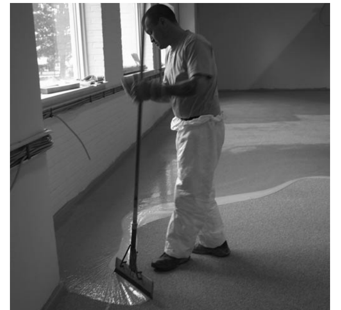
Verteilen von Harz mit einem langstieligen Gummiwischer

Das Material sollte mit langstieligen Rollen aufgerollt oder mit langstieligen Gummiwischern verteilt werden. Dies ermöglicht es, im Stehen zu arbeiten. So reduziert sich das Risiko eines Hautkontaktes.