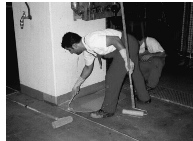
Bodenbeschichtung mit Epoxidharz