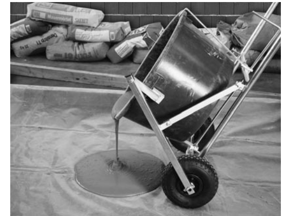
Karre zum Transport und zum Ausgießen

Reaktionswärme zügig ausgegossen und verteilt werden. Bei sehr großen Flächen (z.B. Parkdecks) ist eine Materialverteilung mit Maschinen möglich. Hersteller fragen!