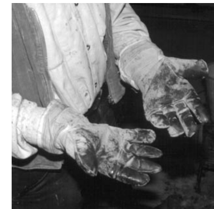
So nicht! Mit Epoxidharz durchtränkte Lederhandschuhe

Bei Verwendung von Lösemitteln oder lösemittelhaltigen Produkten sind auch auf die Lösemittel abgestimmte Handschuhe auszuwählen.