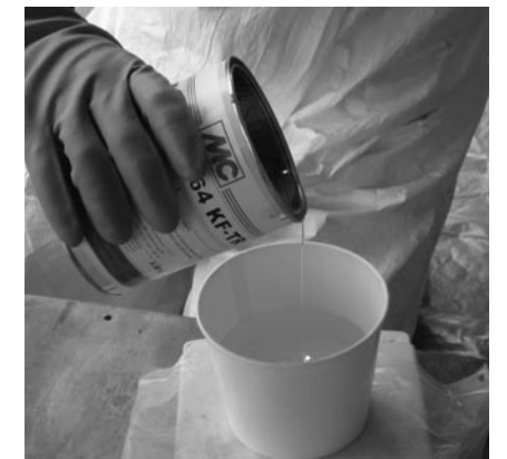
Abwiegen von Harz mit Schutzhandschuhen aus Nitril

Beim Tragen von Schutzhandschuhen sollte Folgendes beachtet werden: