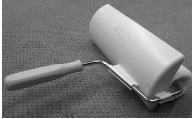
Rolle mit angeklemmtem Spritzschuttschild