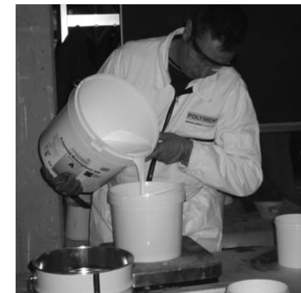
Richtige Schutzausrüstung beim Umgang mit Epoxidharzen